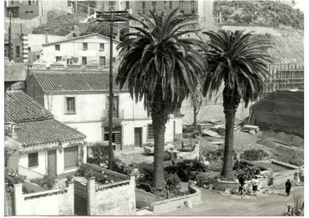
CA N' ALSINA