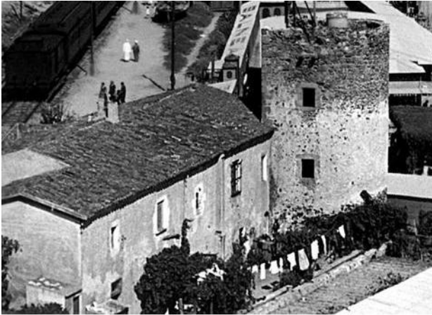
CAN MATHEU —>CA N' ALSINA