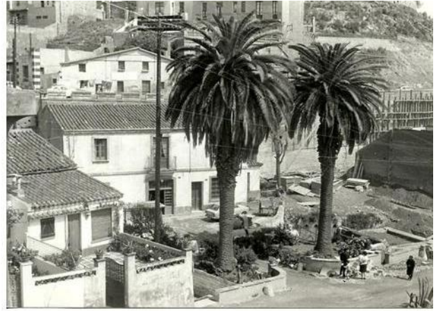
CA N' ALSINA