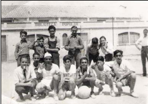
Una de les primeres formacions com a Biblioteca Popular