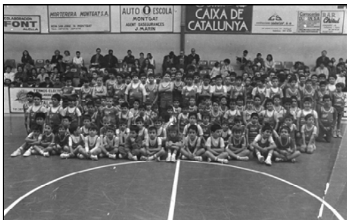
Formació de l'escola de Bàsquet en els primers anys de la seva fundació

Malgrat la fluixa pre temporada, potser motivada pel canvi de preparador, l'equip, que lluia l'anagrama "Farggi", per l'acord amb aquesta empresa montgatina que permetia alleugerir una mica la limitada economia del club, va anar millorant fins acabar una magnífica segona volta, finalitzant la temporada 1985-86 campions del grup Català/Balear de 2a. Divisió Nacional i classificats per anar a Badajoz a jugar la fase d'ascens a Primera Divisió B, categoria que malauradament no vàrem assolir. El gener de 1985 s'inicià l'edició d'un nou butlletí, lligam entre la directiva i els socis, amb continuïtat fins al juliol del 1989.