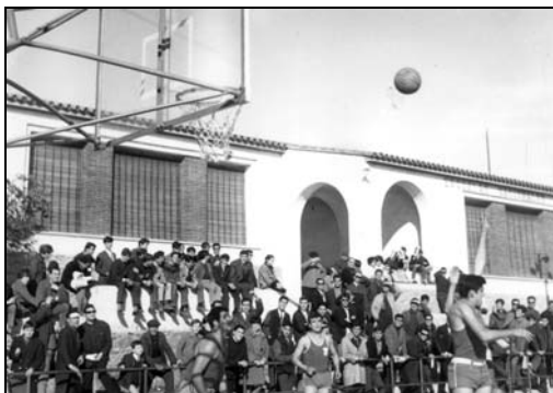
Un partit al camp provisional de les Escoles de Sant Joan