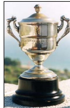
Trofeu subcampionat d'Espanya