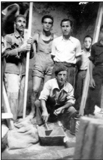
Voluntaris construint el camp

Finalitzada la guerra civil i ocupat el nostre país per les tropes franquistes, es reobre la nostra entitat, canviant el nom original de Biblioteca Popular pel de Unión Deportiva Montgat , i solament pel que fa al bàsquet, doncs les activitats cíviques i culturals no eren tolerades pel nou règim tret que fossin tutelades per la Falange Española Tradicionalista y de las J.O.N.S. o pel Frente de Juventudes .