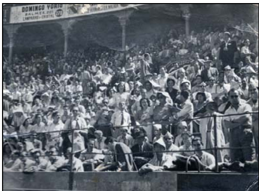
Públic a la final de la plaça de les Arenes

inaugural es va guanyar l'eliminatòria de la copa Barcelona Trofeu Orgaz contra el C.D. Manresa .