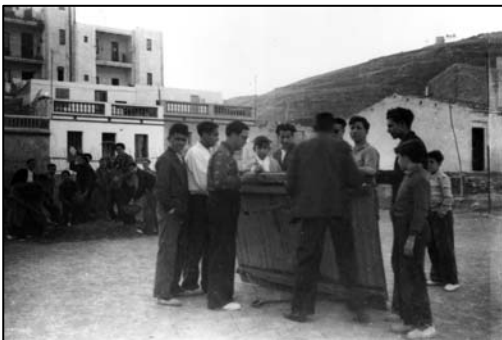
Directius, socis i seguidors en el muntatge del taulers