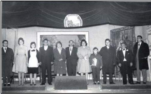
Desembre 1959. Salutació final en una obra de teatre representada a l'escenari del camp del carrer Arno Jäger.