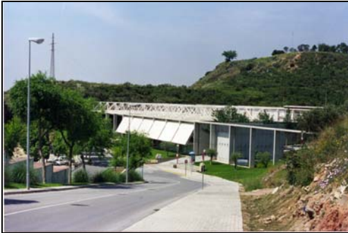
Imatge del pavelló Municipal del Pla de la Concòrdia