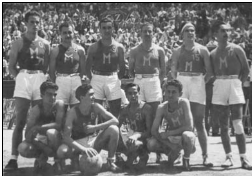
Equip que disputà la final del campionat d'Espanya