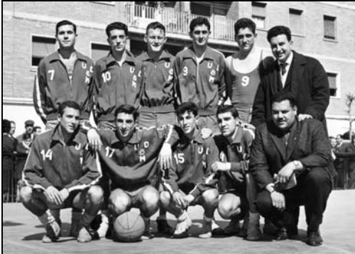
Formació de l'equip a la temporada 1961-62. Camp de la Seat

El 1958-59 l' U.D. Montgat es proclama campió de Catalunya, guanyant tots els partits de la temporada, excepte un jugat amb el Sant Josep , de Badalona. Es jugà la promoció contra el La Salle de Barcelona, guanyant el nostre equip els dos partits que obriren el camí de l'ascens a la categoria superior.