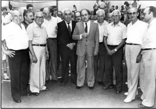
El President de la Generalitat de Catalunya, Jordi Pujol, amb una representació dels socis més antics