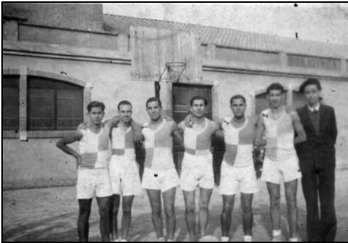
Una formació, encara, amb el nom de Biblioteca Popular